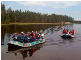
Gegend. Nachtessen in einem Restaurant.

Frühstück à la Pilot Reisen. Ein weiterer Höhepunkt dieser Rundreise ist eine Bootstour durch die finnische Landschaft auf verschiedenen Seen und dem Oulankajoki. Jedes Boot wird begleitet von einem orts- und fachkundigen Führer. Unterwegs gibt's ein Pick